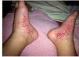
Tâches violettes : purpura

Dès l'apparition d'un de ces signes appeler le SAMU et suivre les consignes du médecin urgentiste, prévenir les parents.