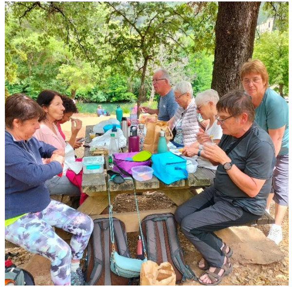
Visite du village ci-dessous