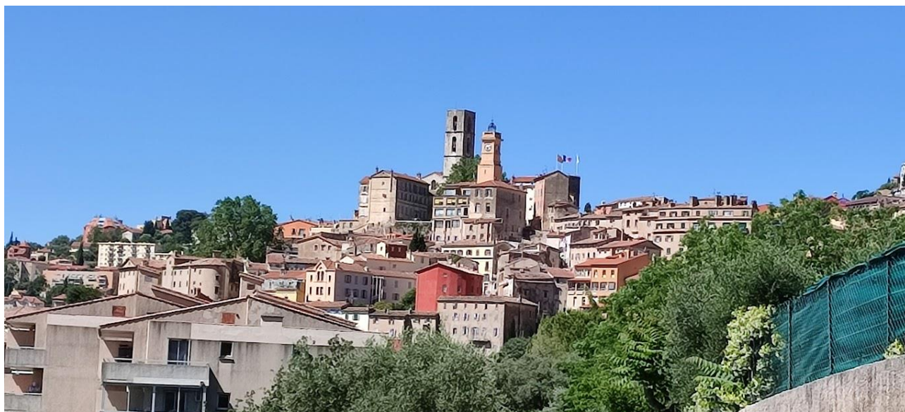
Vue de GRASSE depuis notre hébergement !

Elle est située près de la mer, et possède de nombreux et magnifiques points de vue. Gourdon, Saint Paul de Vence, La Colle sur Loup, Tourrettes sur Loup, etc... sont de très jolis villages à proximité de GRASSE, que nous avons eu plaisir à visiter.