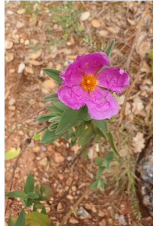
Rando du premier groupe, petits mollets et gros cerveaux !... au plateau de CALERN à CAUSSOLS