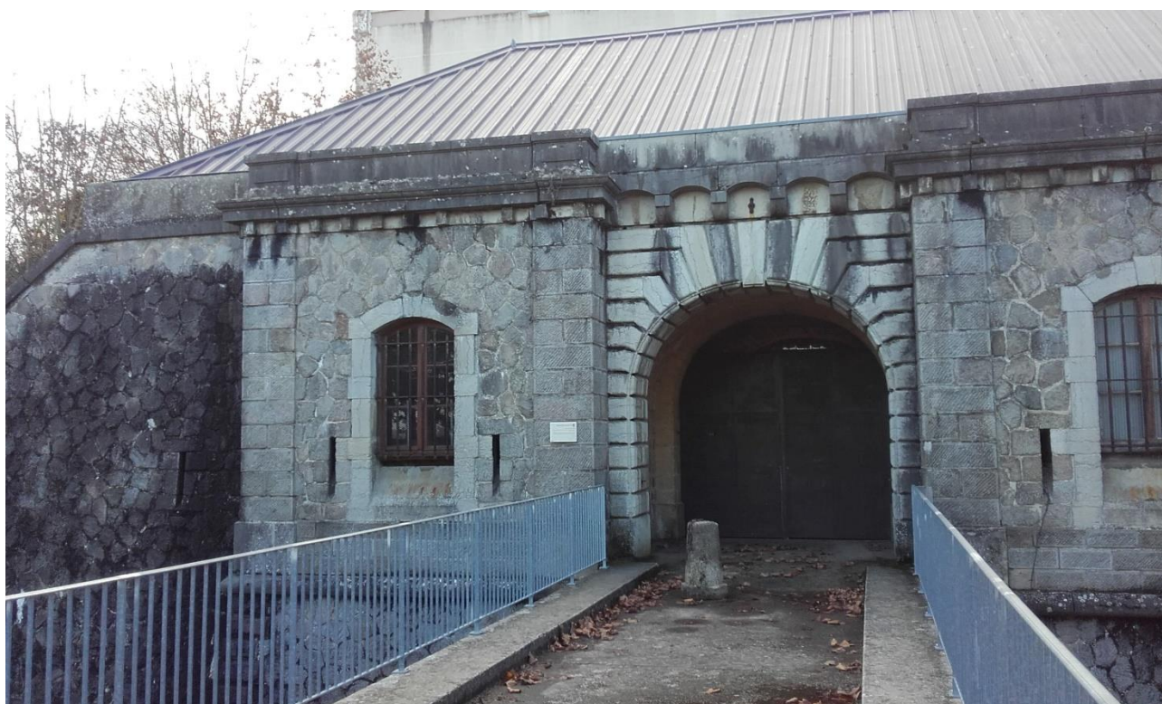
Le Fort de Côte Lorette : Edifié de 1874 à 1894

Fait partie de la grande ceinture de défense de Lyon. On remarquera : son entrée fortifiée, une partie des fossés, les casernements, ainsi qu'un logement civil.