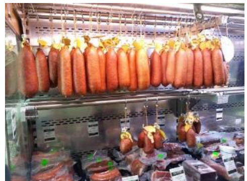
Le tuyé de Papy Gaby et les saucisses de Morteau