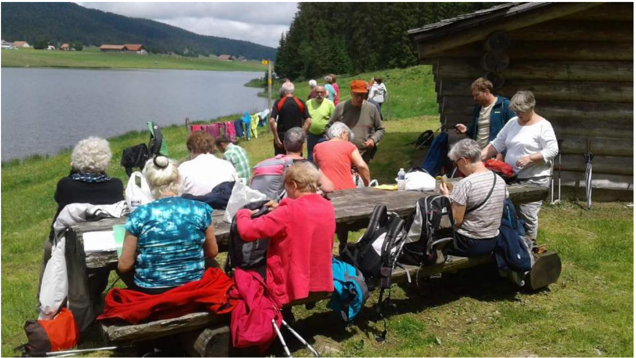
Pique-nique dans un endroit féérique du lac des Taillères