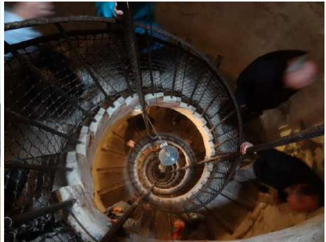
Chateau de joux