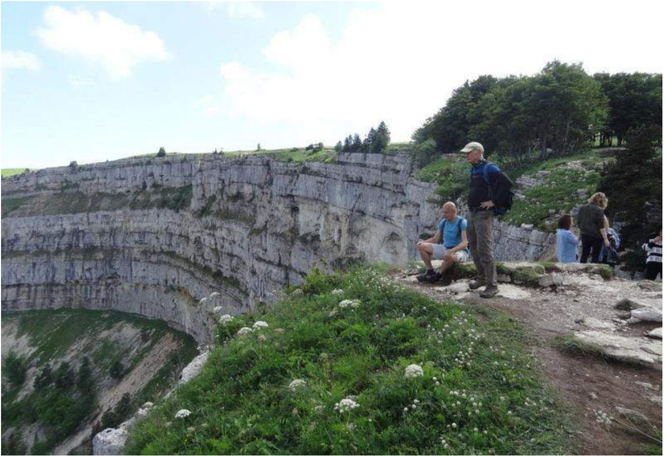
Le Creux du Van