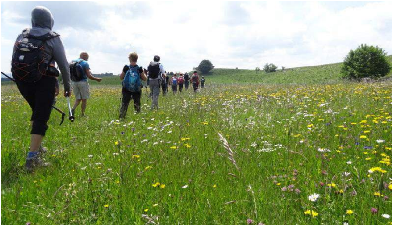
Prairies de fleurs à perte de vue !