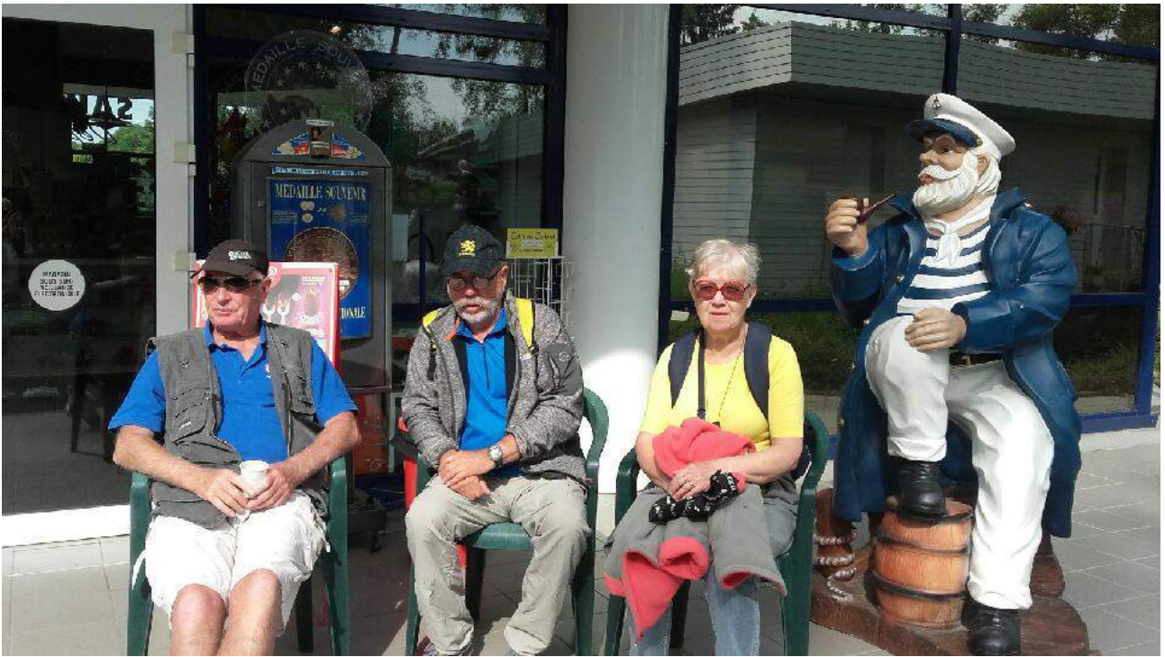
Encore quelques instants à attendre avant l'embarquement !