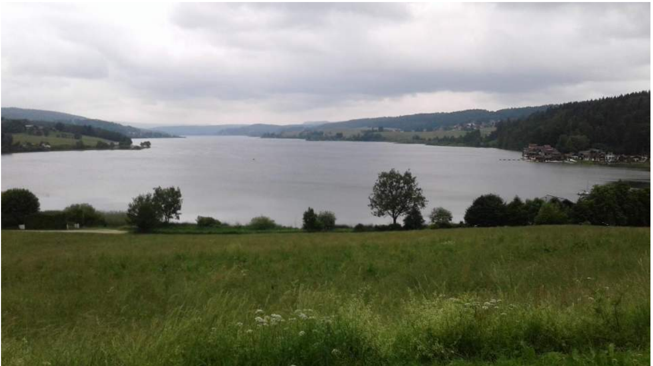
Lac de Saint Point