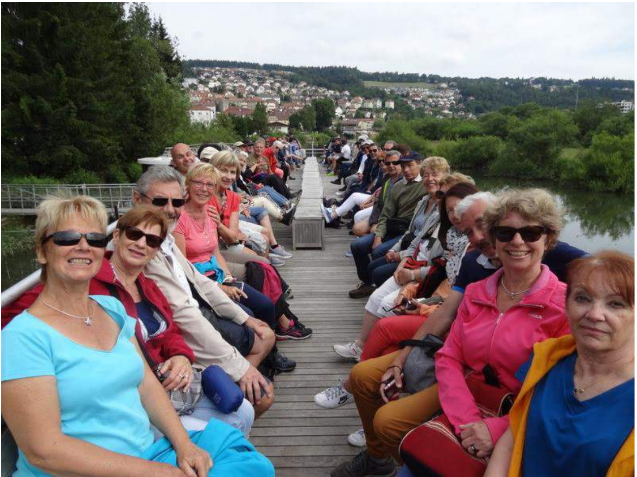
Sur le bateau pour le Saut du Doubs