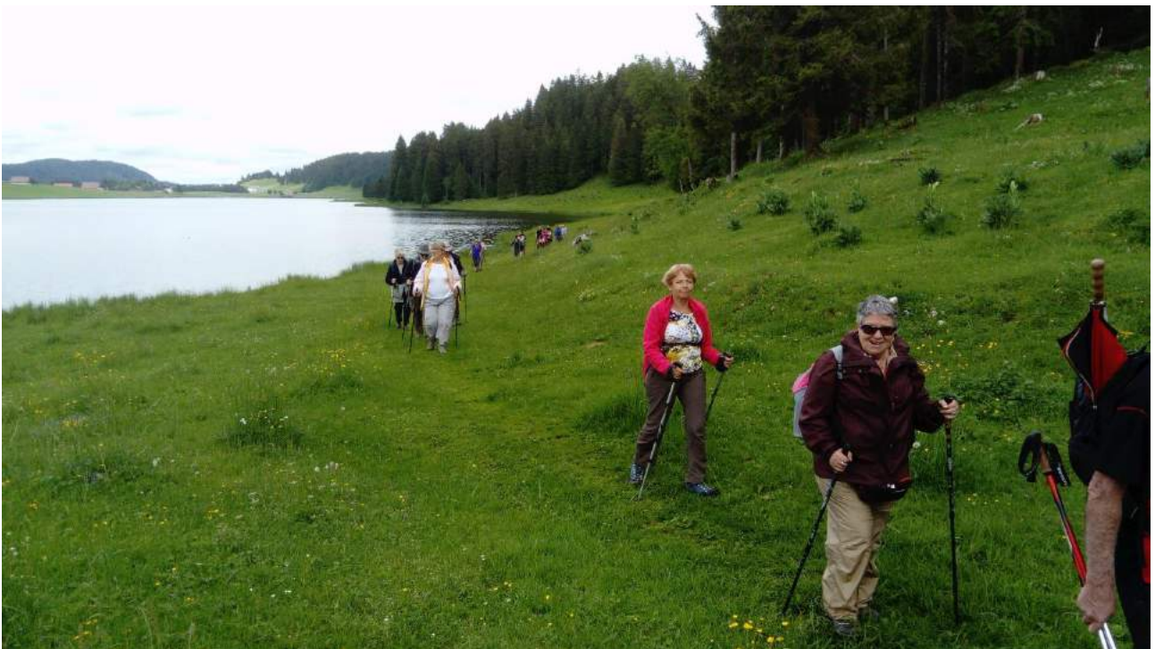
Arrivée au Lac de la Brévine