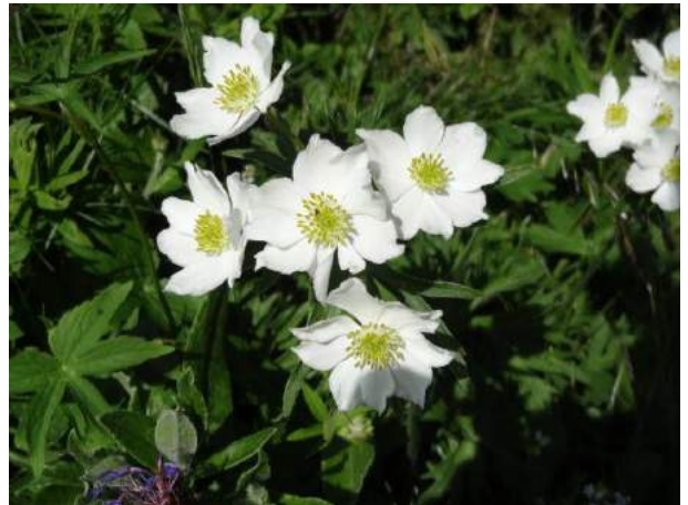
Quelques spécimens de fleurs rencontrées !