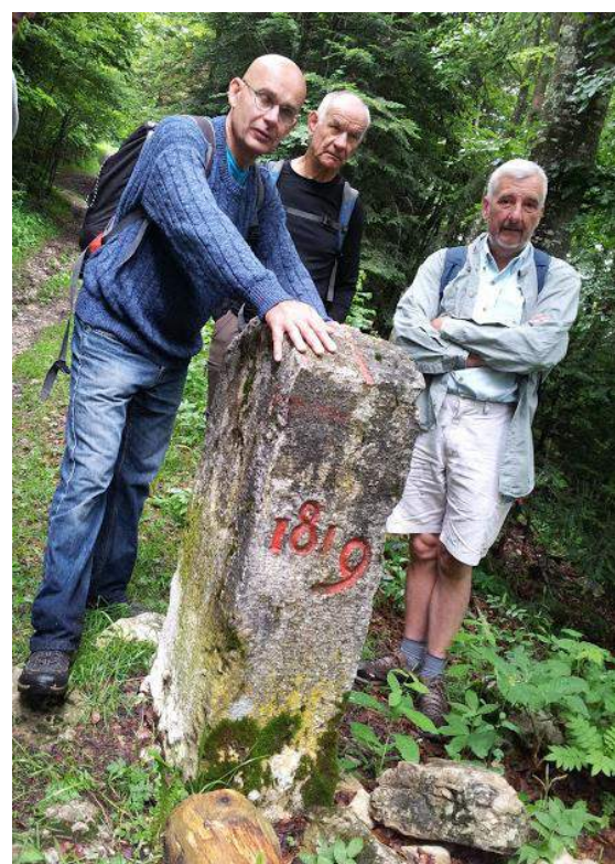
Bornes datant de plusieurs siècles