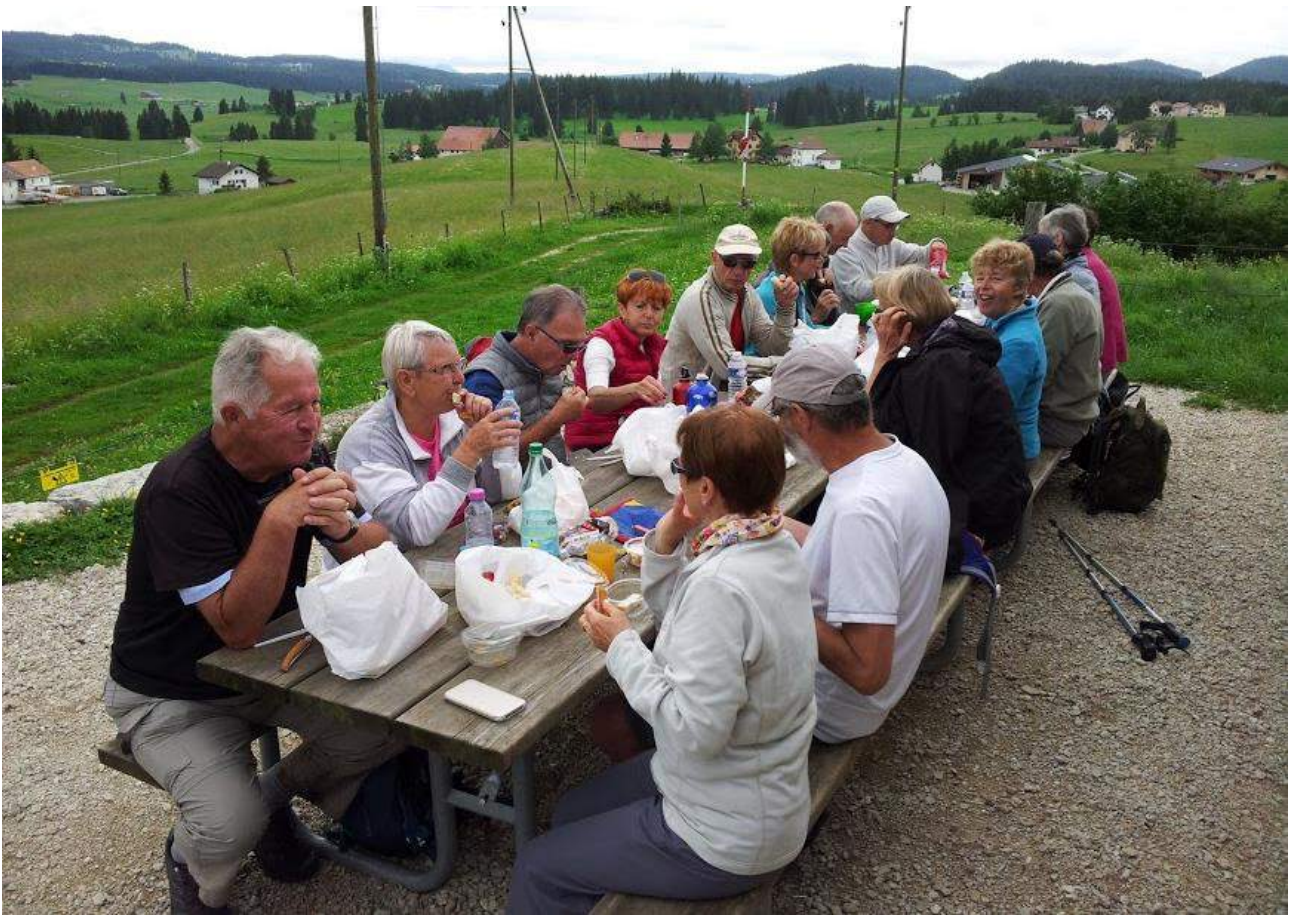
Après l'effort, le réconfort !