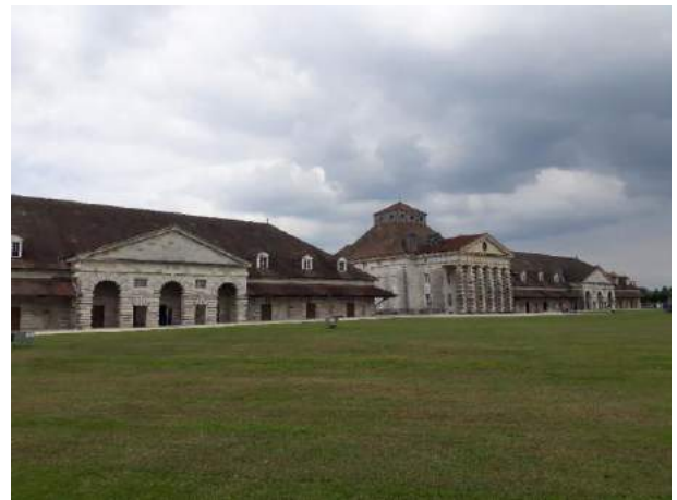
Saline royale d'Arc et Senans