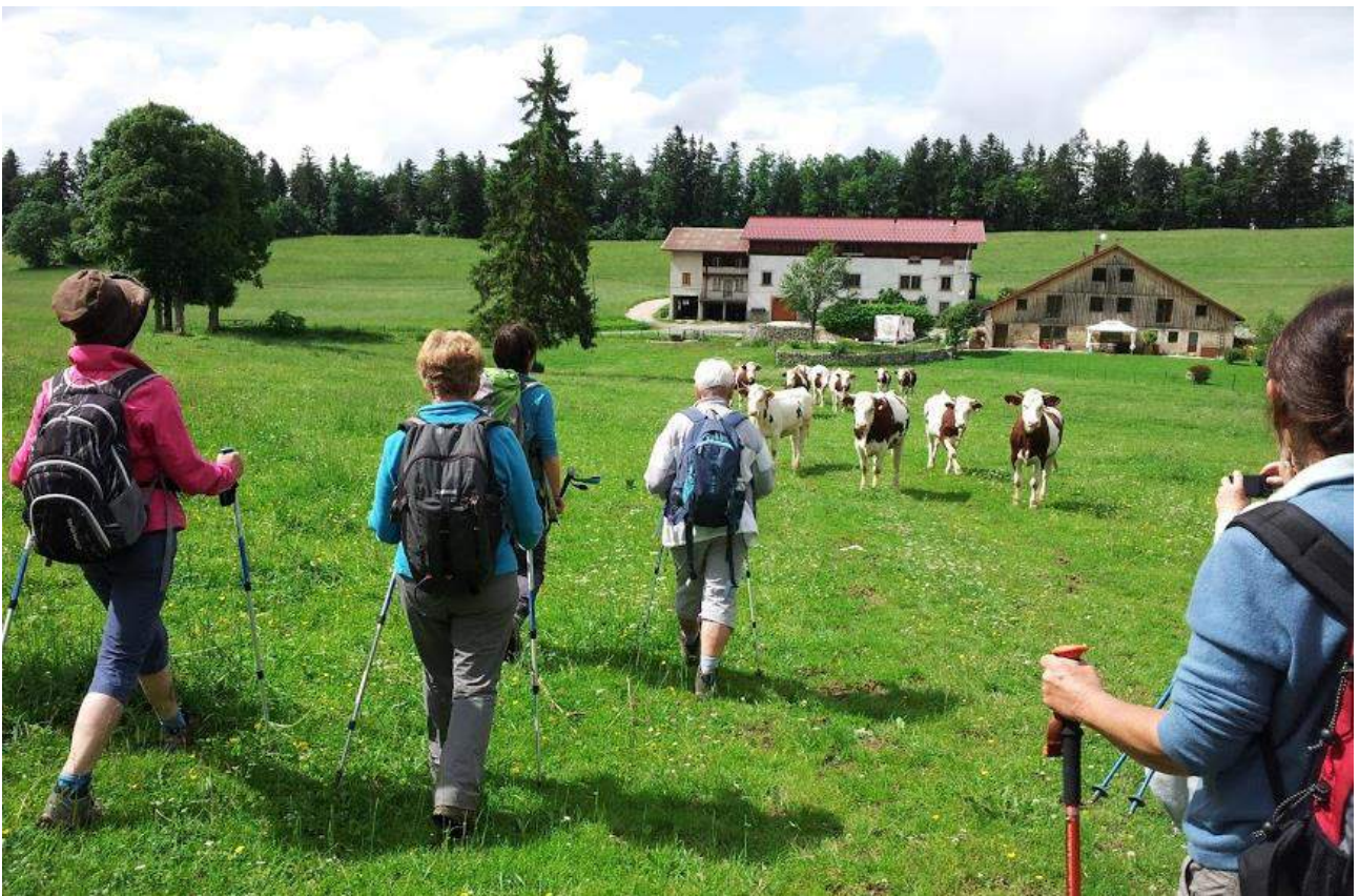
Première rencontre avec nos amies les vaches !