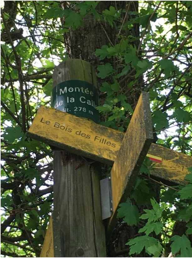
Le Bois des Filles