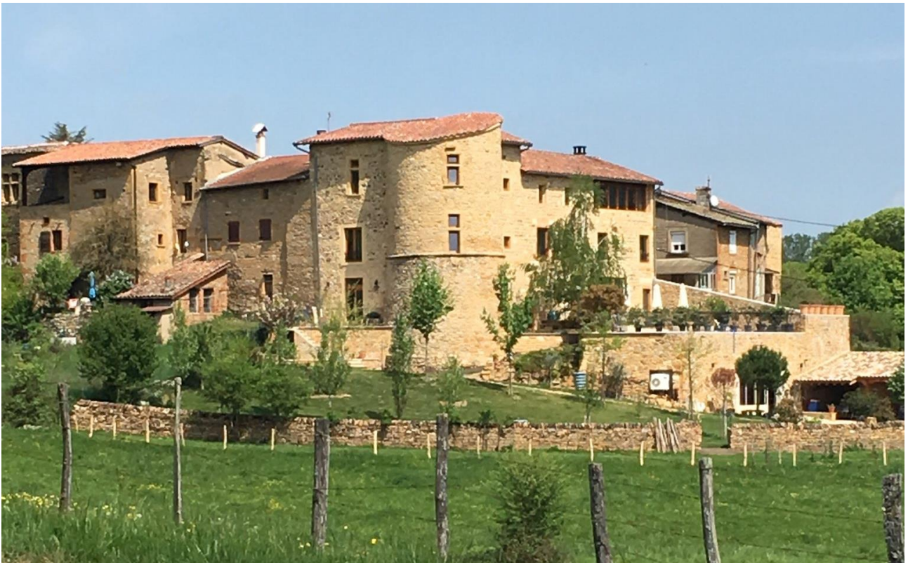
Le Château d'Alix