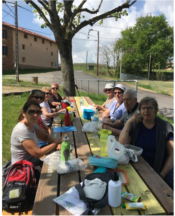
La pause pique-nique