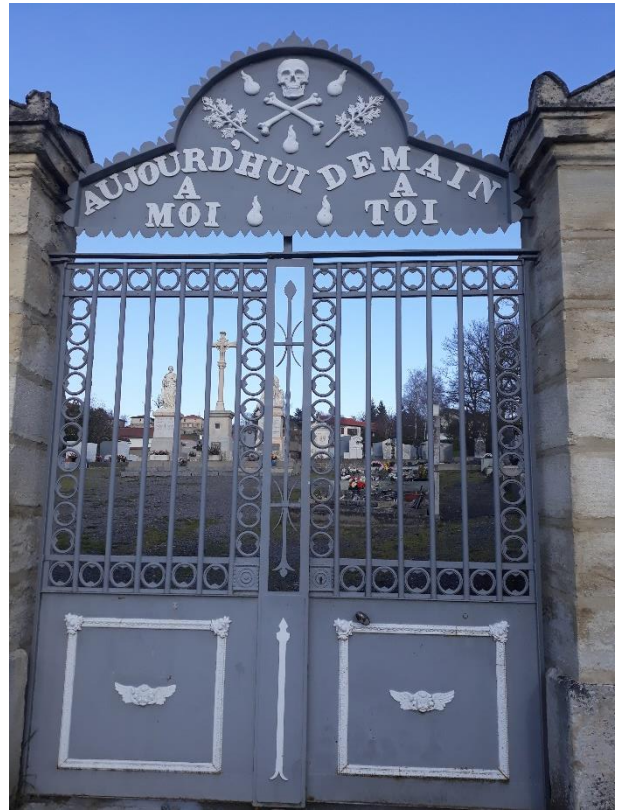
La devise que l'on peut lire sur le portail du cimetière mérite le « détour » .... A méditer !