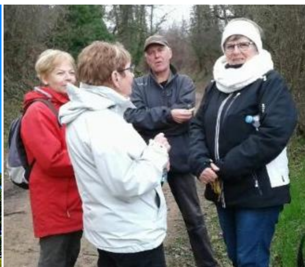
Surpris en plein conciliabule .....