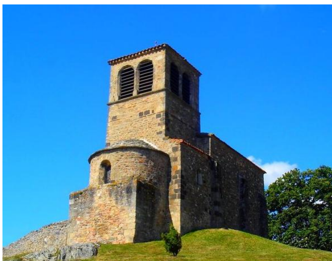
La chapelle St Vincent