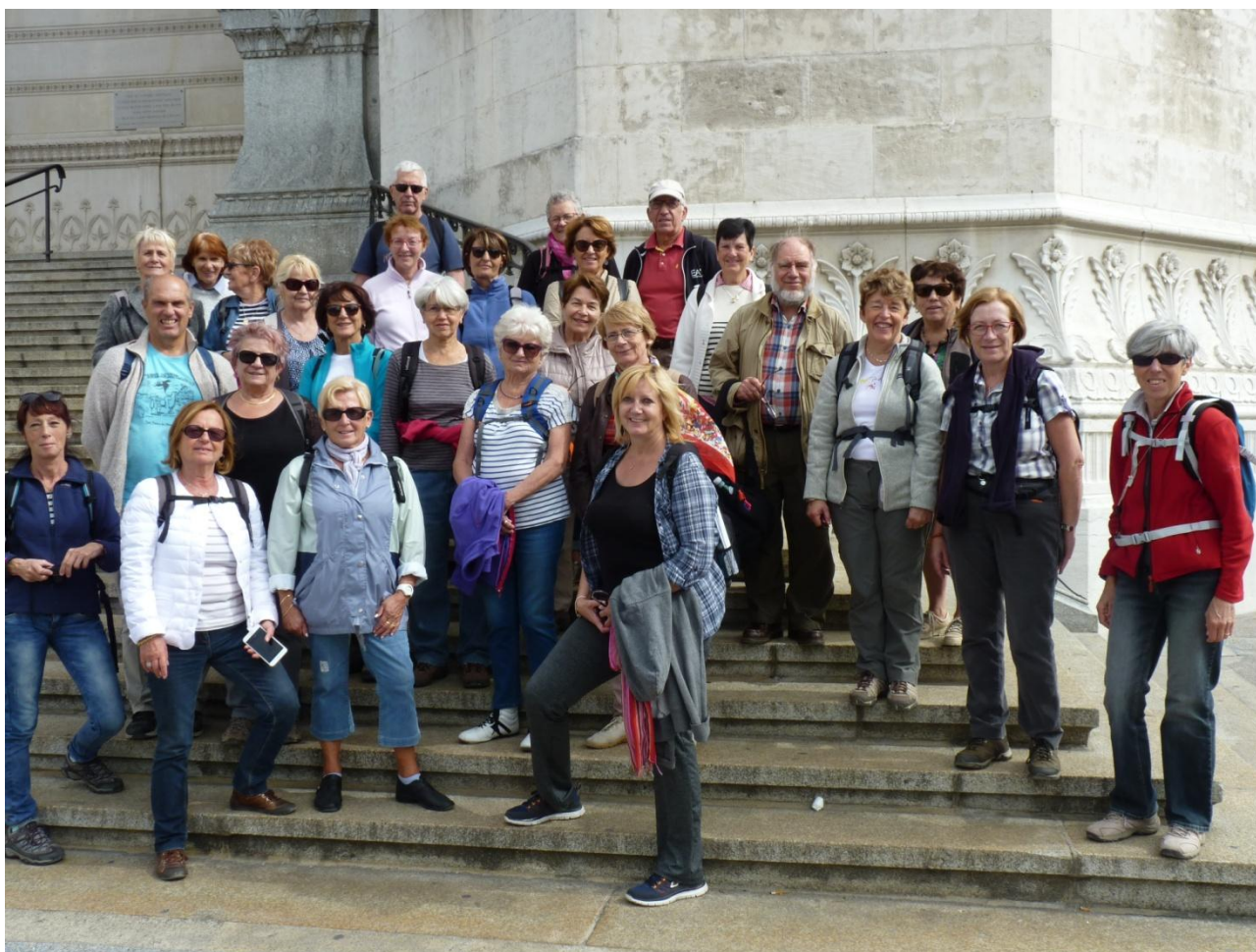
Le groupe sur les marches de la Basilique de Fourvière

Nous étions 28 marcheurs à faire la balade de Fourvière ce mardi 27 septembre 2016.