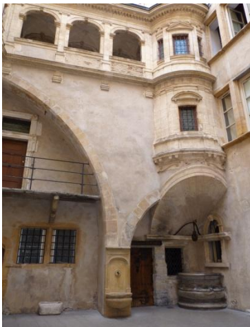
Le 8 de la Rue Juiverie

Nous terminons notre visite par le jardin du Rosaire, le quartier St Jean avec plusieurs cours dont la Tour Rose qui servait de guet pour lutter contre les incendies, des traboules et la Cathédrale St Jean.