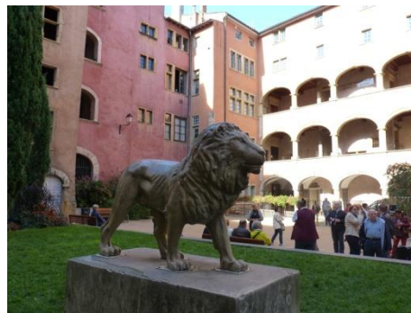
Maison des Avocats à St Jean