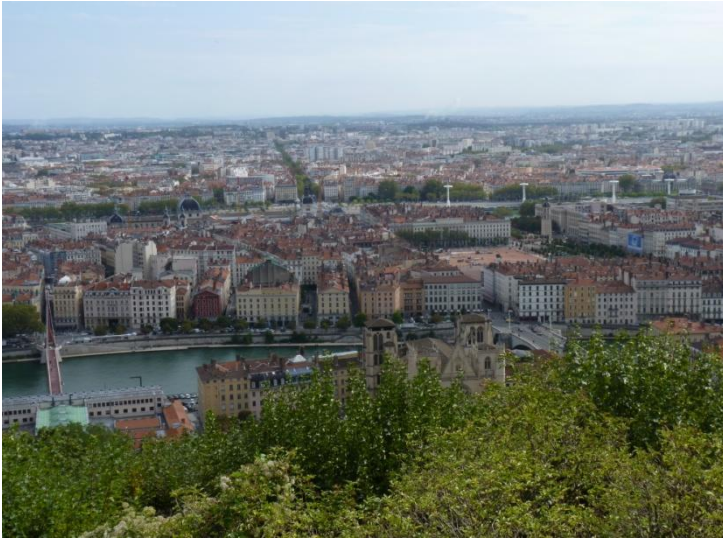
Vue de l'esplanade de Fourvière

Nous continuons par la basilique de Fourvière. Elle a été construite pour remercier la vierge d'avoir protégé la ville de Lyon par trois fois de la peste et également des prussiens.