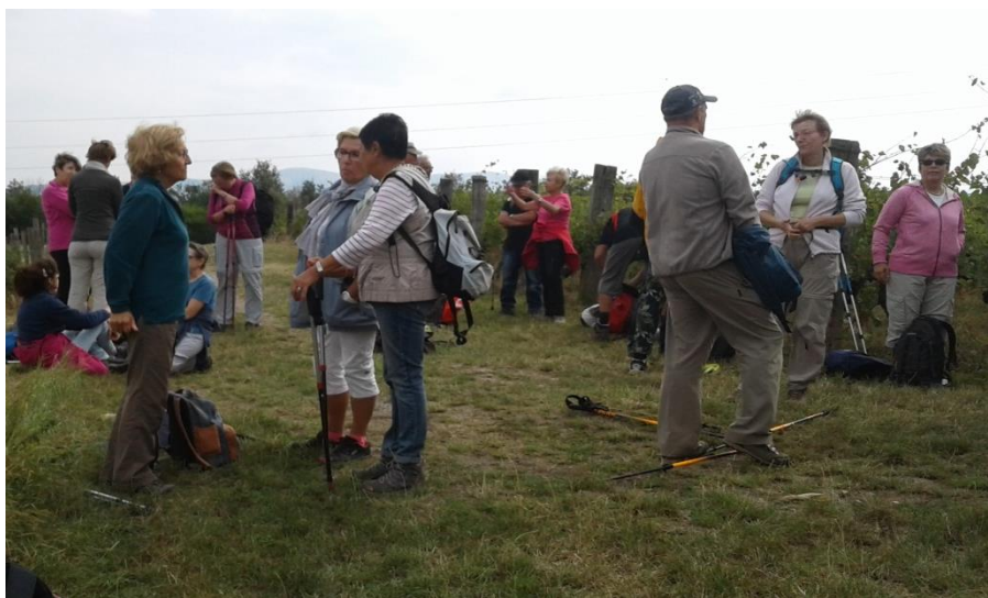
Seize heures, c'est l'heure du goûter !