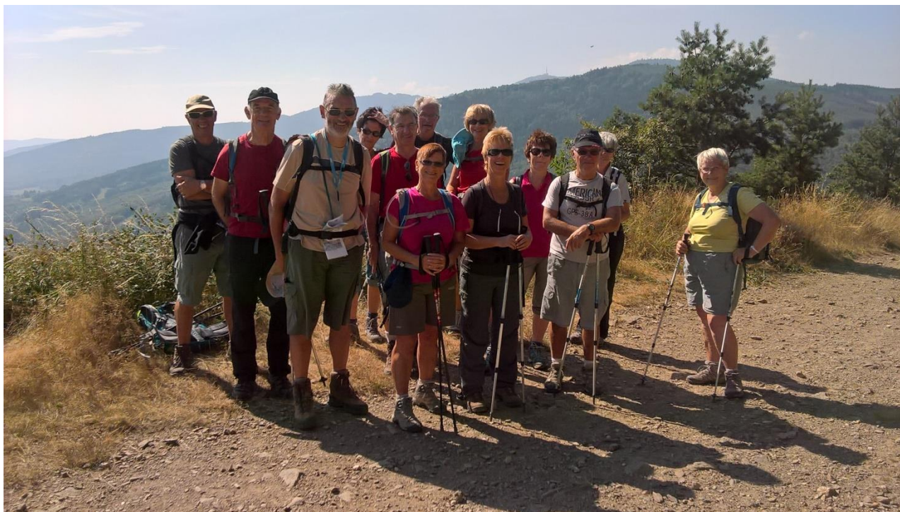
Photos prises non loin de la Croix de Montvieux

Superbe et joyeuse journée à PELUSSIN le 13 septembre pour la 3* ! Le vent fou ne nous a pas quittés de la journée mais n'a pas entamé notre bonne humeur ! Nous souhaitons la bienvenue aux nouveaux marcheurs qui nous ont accompagnés pour cette belle randonnée dans le sud Pilat !