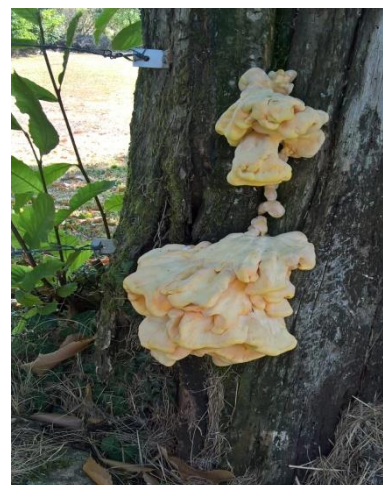
Champignon vu en chemin sur un tronc d'arbre ! Quel nom peut bien avoir ce champignon ? Inconnu pour l'instant.... Dominique TOUILLET.