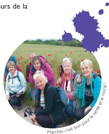
Marcher, c'est bon pour la santé et le moral !