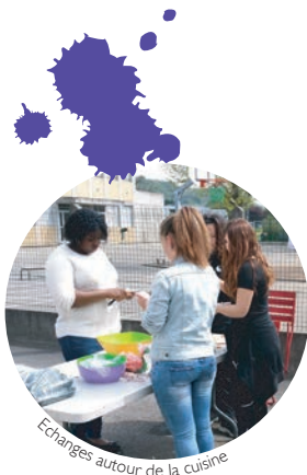
Echanges autour de la cuisine