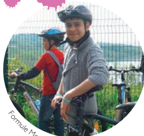
Formule Mer' sortie VTT

L'équipe d'animation reste disponible et à l'écoute pour toute prise de RDV.