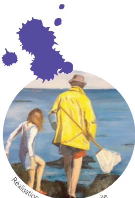
Réalisation stage peinture à l'huile